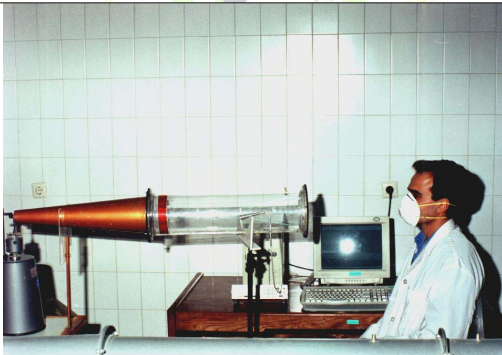
دستگاه آزمون ماسکهای حفاظت تنفسی در برابر گردو غبار در وضعیت آزمون تعیین فاکتور عدم نشتی